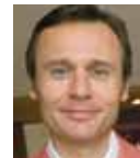
Ernesto Bertarelli Entrepreneur and Alinghi Team President